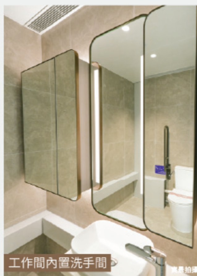
工作間內置洗手間