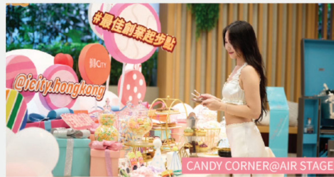
CANDY CORNER@AIR STAGE