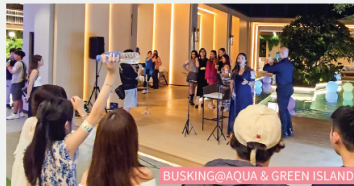
BUSKING@AQUA & GREEN ISLAND