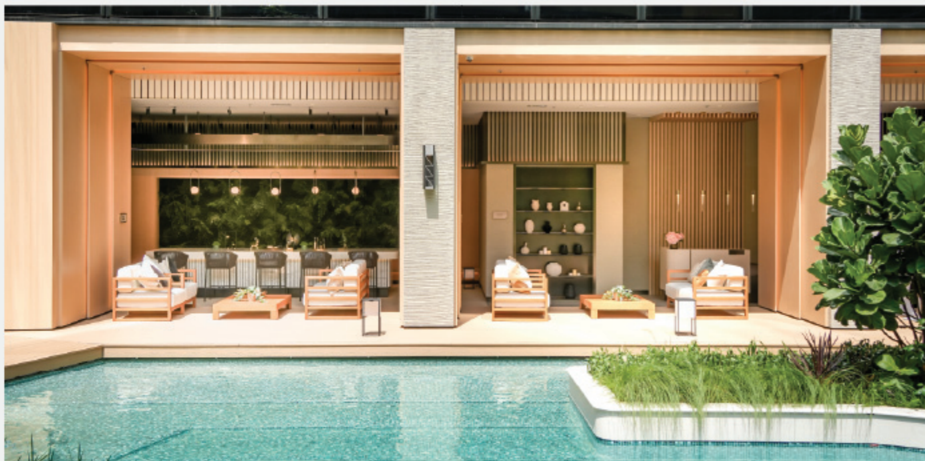
多元化園林平台 the Azure