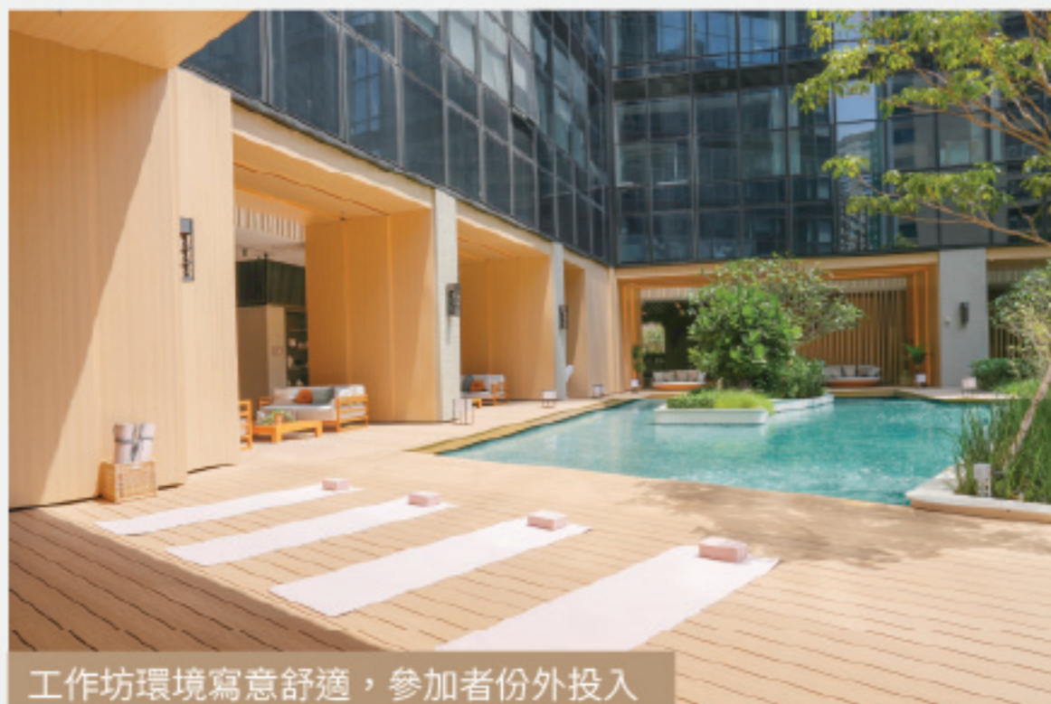
工作坊環境寫意舒適,參加者份外投入