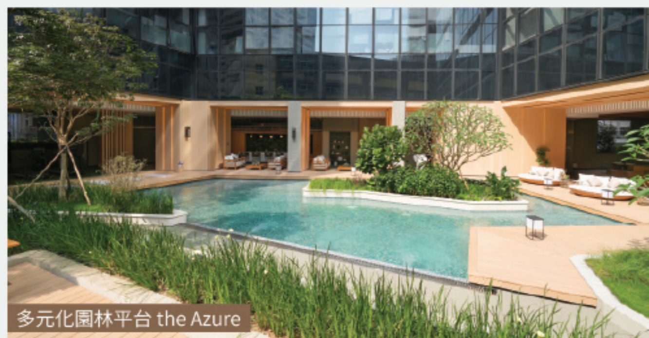
多元化園林平台 the Azure