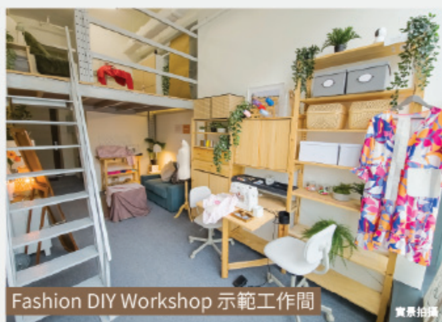
Fashion DIY Workshop 示範工作間