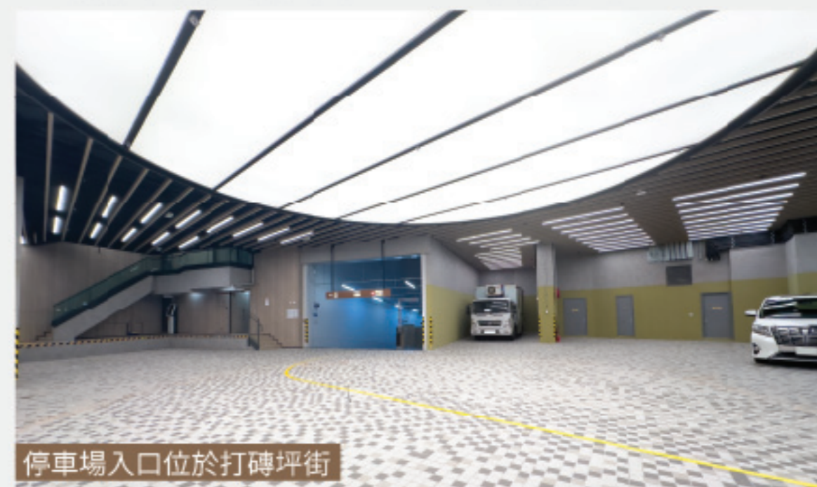
停車場入口位於打磚坪街