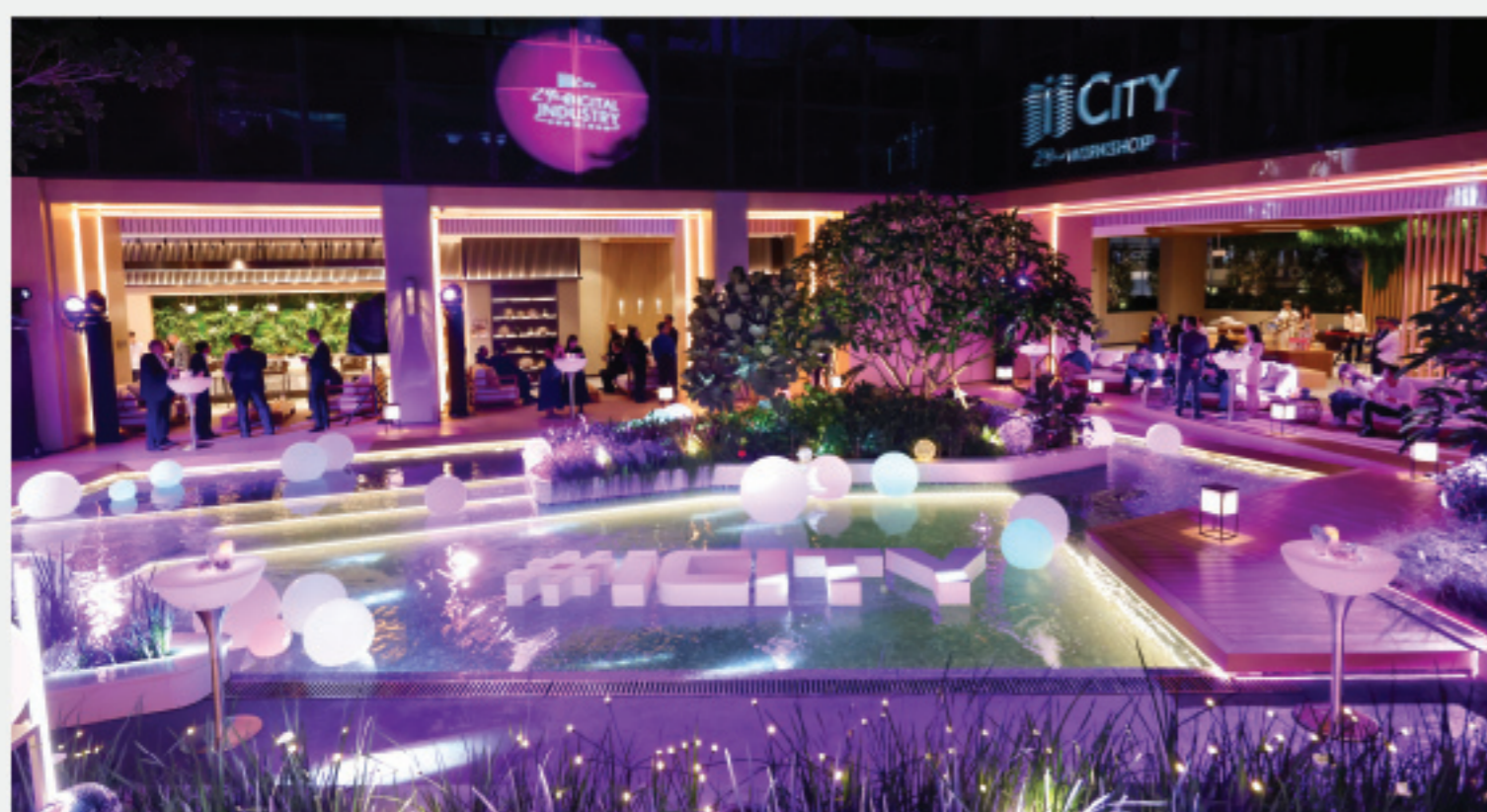
多元化園林平台 the Azure