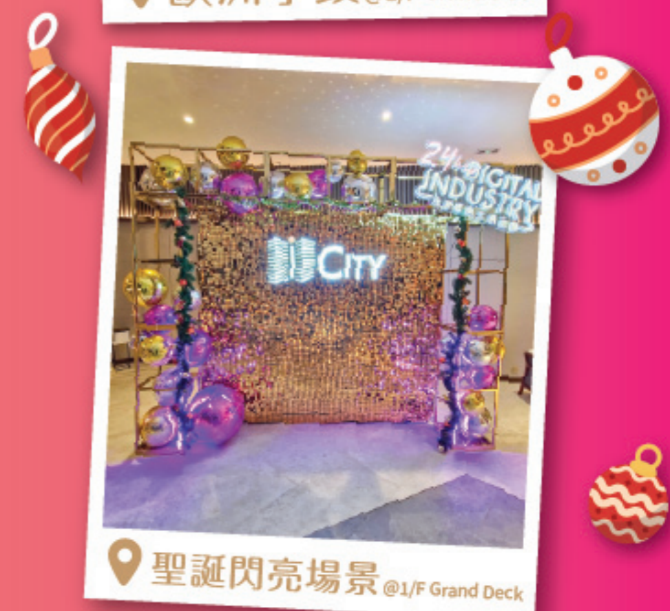
聖誕閃亮場景 @1/F Grand Deck