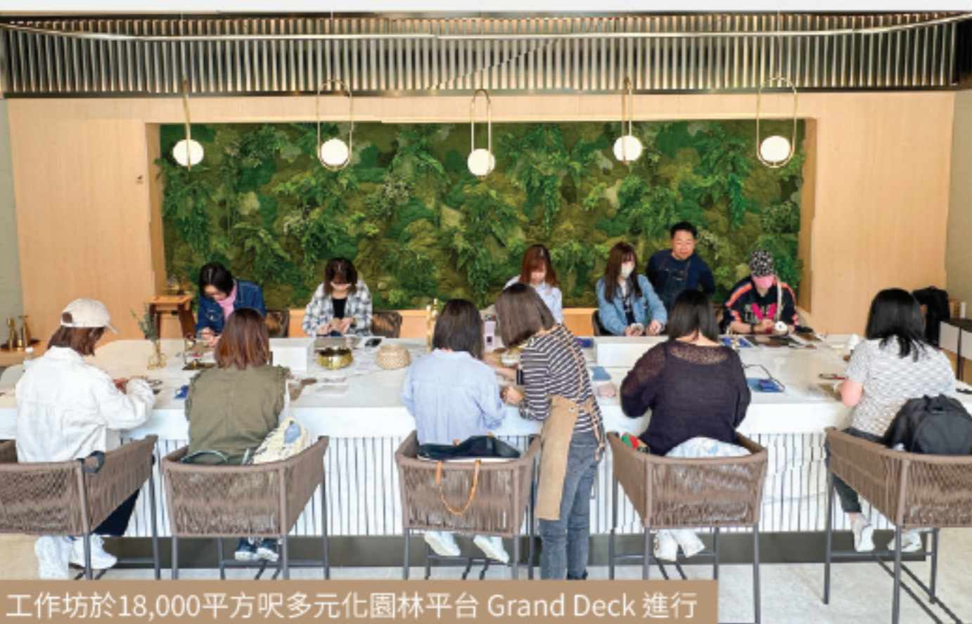
工作坊於18,000平方呎多元化園林平台 Grand Deck 進行

葵涌 iCITY 積極推廣手工藝文化,發展商特別聯同本地原創木藝品牌 Slowwood Creation,於十一月尾舉辦三場木製小夜燈聖誕限定工作坊,透過手藝工作坊,讓大家體驗工匠的製作過程,共同推動本土創意產業,傳承傳統工藝文化。